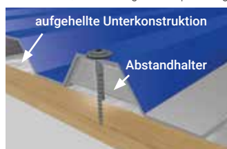
Querschnitt Befestigung der Überlappung

zu rechnen ist, wird jedoch mindestens eine doppelte Überlappung empfohlen. Achtung! Hierdurch verringert sich die Nutzbreite. Überlappungen der Plattenlängen müssen mindestens 200 mm betragen (senkrechte Verlegung 150 mm). Auf jeder zweiten Welle sowie auf der Überlappung müssen die Platten mit Abstandhaltern mit der Unterkonstruktion verschraubt werden (ausgenommen PC Welle Wabe, siehe Acryl-Verlegung). Überprüfen Sie die Platten auf gleichmäßige Auflage der Profile und nehmen Sie, wenn nötig, Fein Anpassungen vor. Zum Befestigen eignen sich am besten